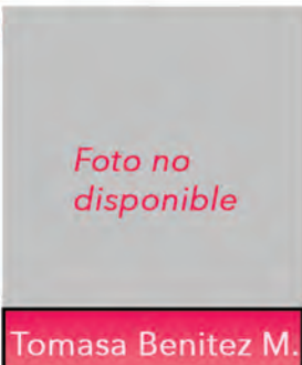
Foto no disponible